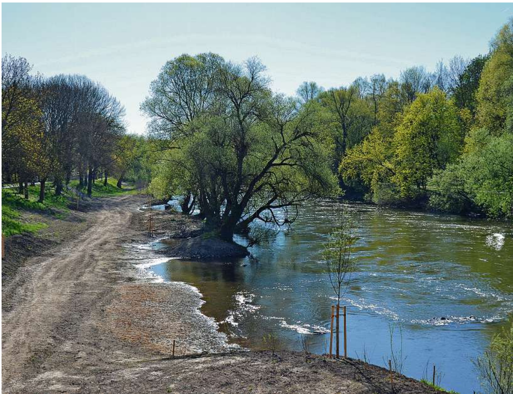
Das Wasserwirtschaftsamt gestaltet bis Herbst die Ufer des nördlichen Donauarms um .